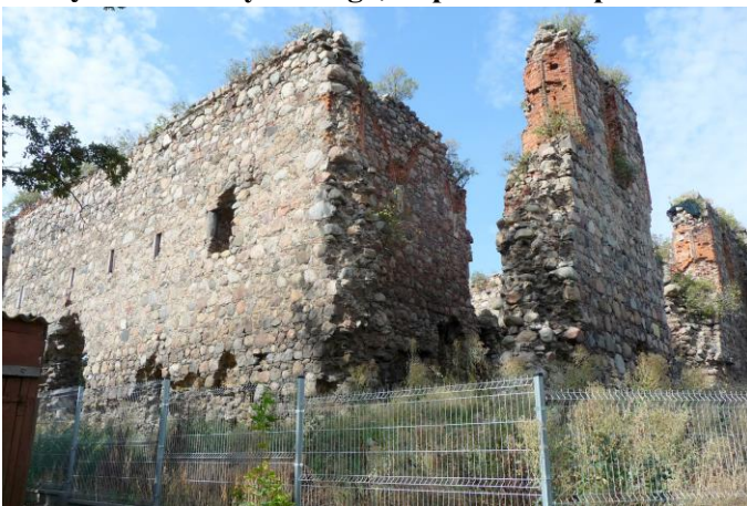
Zdjęcie nr 3. Ruiny zamku krzyżackiego, Papowo Biskupie

Zamek powstał w końcu XIII w. (gród wzmiankowano w 1279 r.) jako siedziba komturów krzyżackich w latach 1287-1421, później wójta krzyżackiego. W 1454 r. z polecenia Związku Pruskiego zdobyty przez mieszczan toruńskich, którzy wzięli tu do niewoli wielkiego marszałka Zakonu oraz komturów gdańskiego i grudziądzkiego. W tym samym roku król Polski Kazimierz Jagiellończyk nakazał rozbiórkę zamku. Zamek został jednak w 1458 r. opanowany przez Krzyżaków, następnie odbity przez wojska królewskie pod dowództwem kasztelana poznańskiego Piotra z Szamotuł; wówczas spalony. Od 1458 r. w posiadaniu wojewody chełmińskiego, Gabriela Bażyńskiego. W 1472 r. obradował tu sejmik pruski. W latach 1502-1772 zamek był własnością biskupstwa chełmińskiego. Kolejne zniszczenia przyniosła rozbiórka kamienia w XVII w., służącego jako budulec dla powstającego seminarium duchownego w Chełmży oraz w XIX w. przez miejscową ludność. Od XVII w. w ruinie, konserwowany m.in. w 1931 r.