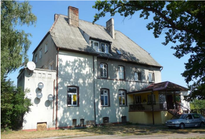
Zdjęcie nr 12. Pałac, ob. budynek mieszkalny, Papowo Biskupie nr 27

Założenie stanowi dawny budynek zarządcy domeny, obecnie budynek mieszkalny usytuowany na niewielkim wzniesieniu w pobliżu ruin zamku, z końca XIX w., przed 1913 r., przebudowany w 1975 r. Budynek na planie prostokąta, murowany z cegły, otynkowany, z podpiwniczeniem oraz częściowo mieszkalnym poddaszem. Fasada półn. z ryzalitem uwieńczonym trójkątnym szczytem. Fasada połd. również posiada ryzalit z oknem w części parterowej oraz dwoma zamurowanymi oknami w wyższej kondygnacji. Do części parteru przylega drewniana weranda z balustradą, przykryta daszkiem pulpitem, o pokryciu z eternitu. Elewacja wsch. także z ryzalitem z zamurowanymi otworami okiennymi. Do elewacji zach. przylega prostokątna przybudówka, zamknięta od góry tarasem. Dach budynku naczółkowy, pokryty eternitem falistym. W połaci dachu umieszczona jest lukarna. techniczny i stan zachowania budynku w części mieszkalnej jest bardzo zły. Na tyłach podwórza rośnie pojedynczo i w małych grupkach kilkanaście drzew liściastych. Stan zachowania obiektu – dobry.