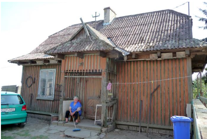
Zdjęcie nr 5. Jeleniec nr 16

Poniatówki są to małe osiedla wiejskie, powstałe w okresie parcelacji ziem w latach 30-tych XX w. Inicjatorem akcji osadniczej był ówczesny minister rolnictwa Juliusz Poniatowski.