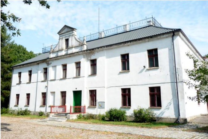
Zdjęcie nr 15. Dwór, Zegartowice nr 1

Zespół składa się z trzech elementów: część rezydencjonalna z dworem i parkiem, od zach. część gospodarcza, kolonia mieszkalna na płn.-zach. od dworu złożona z trzech ośmioraków oraz z budynkami gospodarczymi.