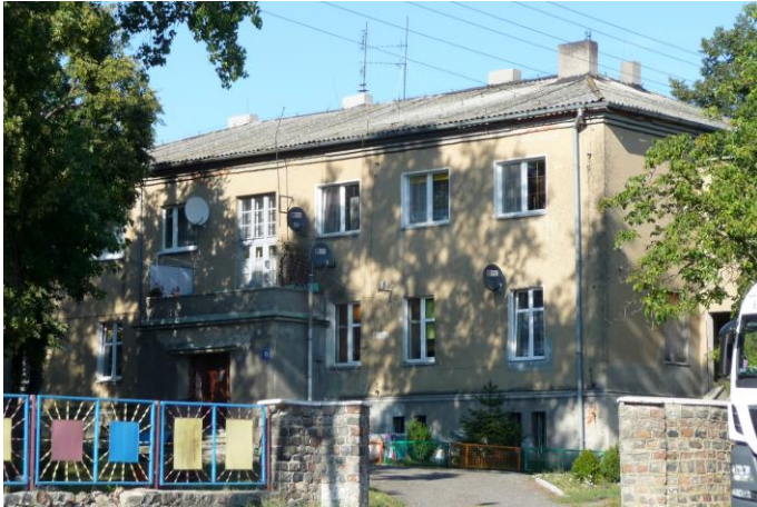
Zdjęcie nr 8. Dwór, Fałęcin nr 11

Zespół składa się z dworu z parkiem oraz budynków gospodarczych: spichlerza (k. XIX w.), budynku gospodarczego (pocz. XX w.) oraz trzech budynków inwentarskich (pocz. XX w.),