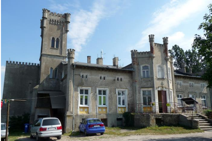
Zdjęcie nr 9. Pałac, Jeleniec nr 61

Na zespół składają się trzy elementy: część rezydencjonalna z pałacem i parkiem, od. zach. część gospodarcza oraz duża kolonia mieszkalna, usytuowana na zach. od podwórza gospodarczego i złożona z czterech czworaków, sześcioraka i dawnej szkoły.