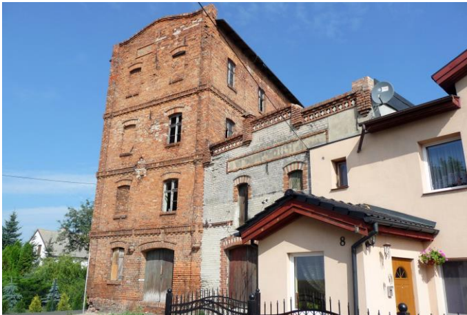
Zdjęcie 6. Młyn z budynkiem gospodarczym, Papowo Biskupie nr 8

Młyn jest obecnie nieczynny. Budynek pochodzi z końca XIX w. Jest to budynek z cegły ceramiczne, pełnej, na planie prostokąta, czterokondygnacyjny, dach płaski, kryty papą. Frontowa elewacja dwuosiowa,