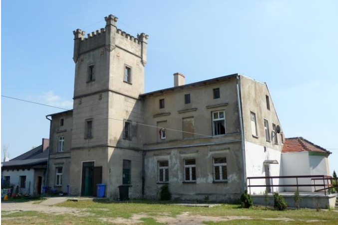
Zdjęcie nr 14. Pałac, Storlus nr 10

Zespół obejmuje trzy elementy: część rezydencjonalną z pałacem i parkiem, część gospodarczą od pld. (częściowo zachowana kuźnia z 1891 r., budynki inwentarskie z przełomu XIX/XX w.), duża kolonia mieszkaniowa usytuowana w pln. części zespołu.