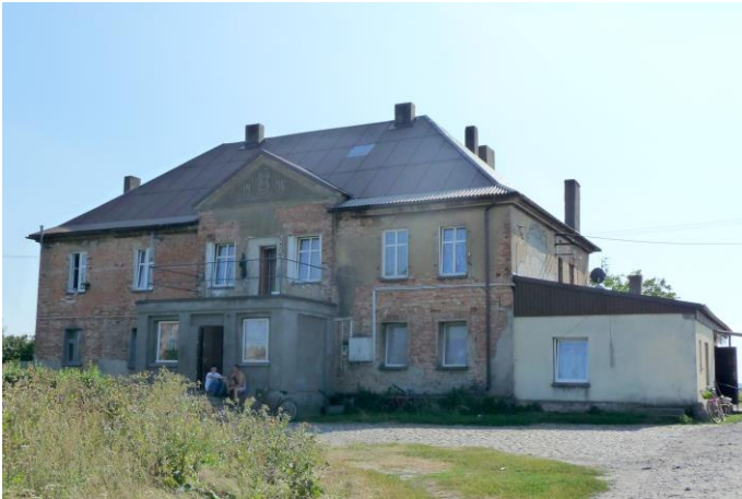
Zdjęcie nr 7. Pałac, Dubielno nr 73