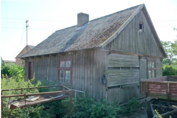
Zdjęcie nr 4. Dubielno, dz. nr 35/2