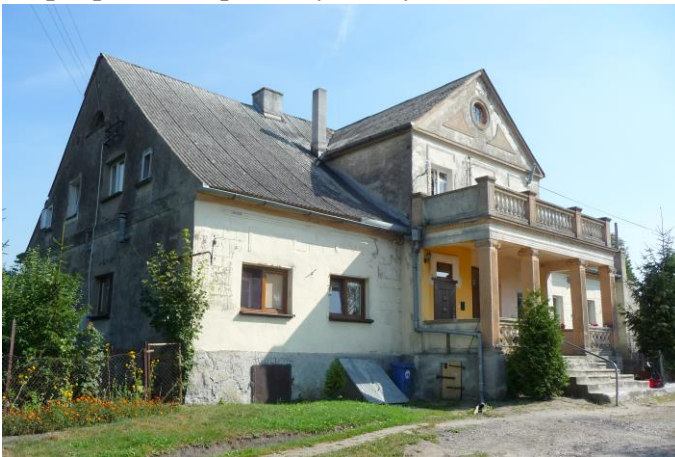
Zdjęcie nr 11. Pałacyk, Nowy Dwór Królewski nr 13

Pałacyk powstał ok. 1875 r., usytuowany w zach. części wsi, z dala od zabudowań gospodarczych, frontem zwrócony na zach. Murowany, otynkowany, podpiwniczony, z częściowo mieszkalnym poddaszem. Założony na planie prostokąta, dwutraktowy. Bryła zwarta, jednokondygnacyjna, kryta dachem dwuspadowym, kryta eternitem falistym. W części środkowej elewacji frontowej znajduje się ryzalit z wejściem głównym, zwieńczony tympanonem z okrągłym otworem. Na wysokości piętra w ryzalicie znajduje się balkon z tralkową balustradą. W części środkowej elewacji tylnej zlokalizowana przybudówka, również zwieńczona tympanonem. Do elewacji południowej w części parteru przylega przybudówka. Stan zachowania obiektu – dobry.