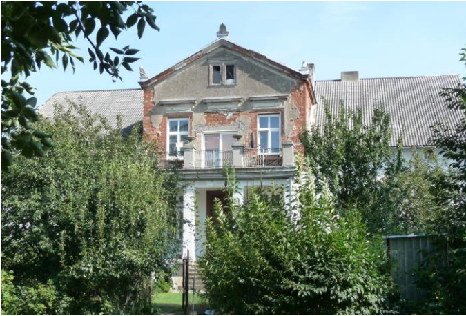
Zdjęcie nr 10. Pałac, Niemczyk nr 9

Pałac powstał w ok. 1800 r., usytuowany w płn.-wsch. części wsi, otoczony od płn. parkiem. Zwrócony frontem na płn. Murowany z cegły, otynkowany, podpiwniczony z mieszkalnym poddaszem. Założony na planie prostokąta, dwutraktowy. Bryła zwarta, jednokondygnacyjna, kryta dachem dwuspadowym. Elewacje podzielone prostokątnymi oknami, fasada siedmioosiowa. Do środkowej części, na parterze, przylega ganek, wsparty na czterech prostokątnych filarach, zamknięty od góry balkonem. Stan zachowania obiektu – zły.