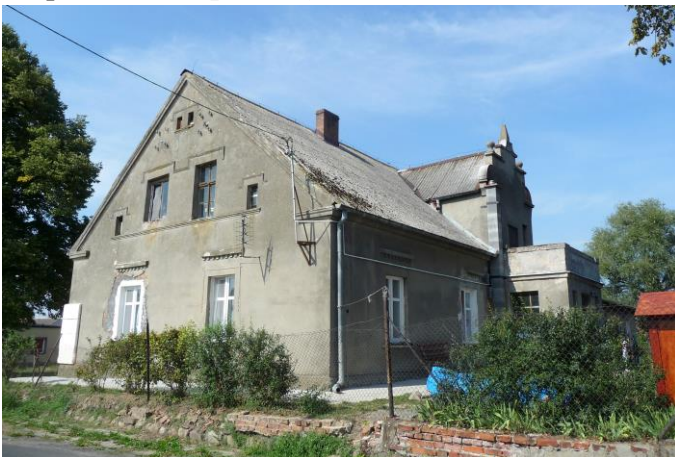
Zdjęcie nr 13. Dwór, Staw nr 16

Dwór pochodzi z ok. 1870 r., założony na planie prostokąta, murowany z cegły, otynkowany, bez podpiwniczenia. Elewacja frontowa w części środkowej z lekko zarysowanym ryzalitem z trójkątnym szczytem. W ryzalicie główne wejście do budynku. Elewacja tylna z murowaną werandą usytuowaną w osi budynku. Nad werandą w połaci dachowej znajduje się facjata zwieńczona szczytem o formach eklektycznych. Dach budynku dwuspadowy, kryty eternitem. Od strony półn. do dworu przylega przybudówka z dachem płaskim, krytym papą. Stan zachowania obiektu – dobry.