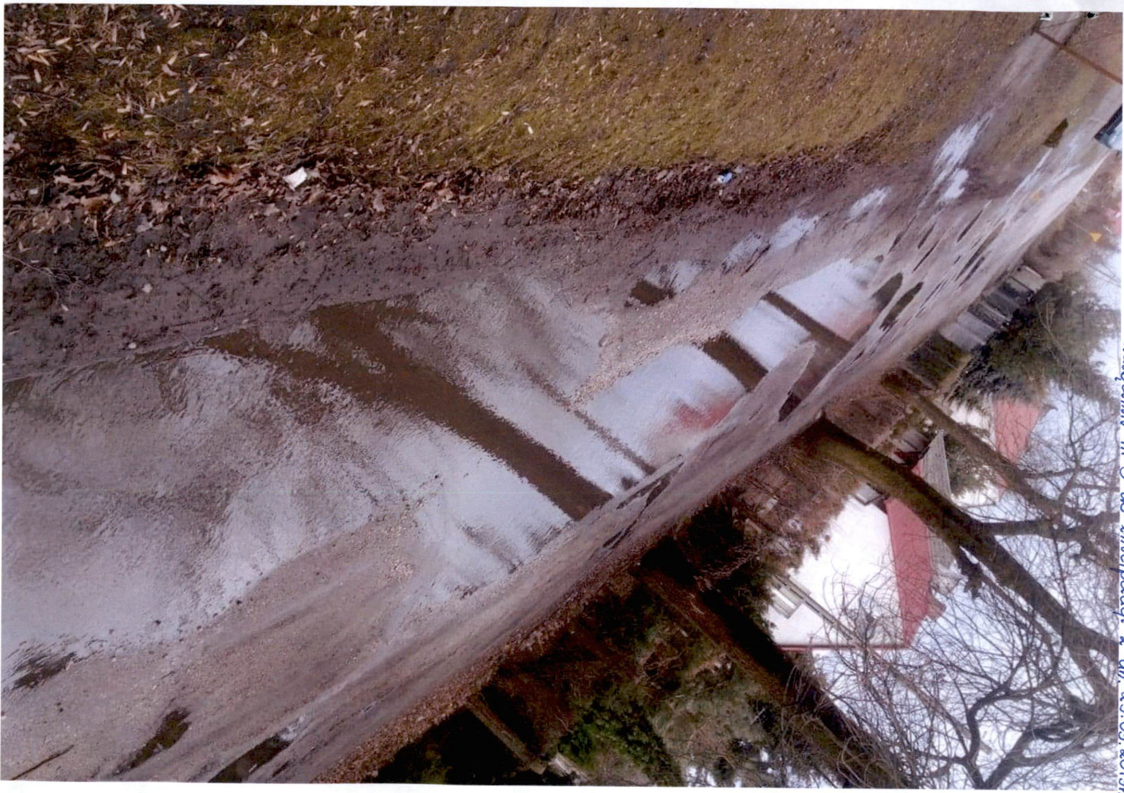
Dočasná cesta nr 3 do interpeláci z dn. 29.03.2019.